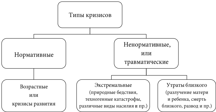
Рис. 1. Типы кризисов

Проблема существования определенных возрастных периодов в процессе развития личности поднималась в многочисленных исследованиях зарубежных авторов и рассматривались в разных аспектах. В первую очередь, это представления о смене некоей структуры или организованности: например, теория стадий развития сексуальности З. Фрейда, теория развития интеллекта Ж. Пиаже и другие.